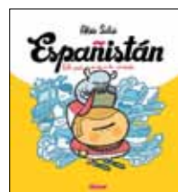
'Españistán' de Aleix Saló, publicado por Ediciones Glénat en 2011.

En mayo de 2011, auspiciado por el estallido de indignación, veía la luz, además del cómic, un corto de animación: Españistán, de la burbuja inmobiliaria a la